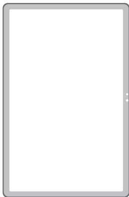
Tablet HONOR Pad X8a

Este manual se aplica apenas aos produtos importados e distribuídos no território brasileiro pela DL Comércio e Indústria de Produtos Eletrônicos Ltda. (DL), distribuidora reconhecida como oficial pela HONOR Corporation.